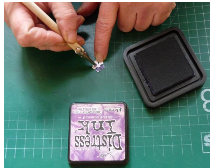
02 pons de floral punch bloemetjes en beinkt ze daarna met een krokodillenbek en pompon .