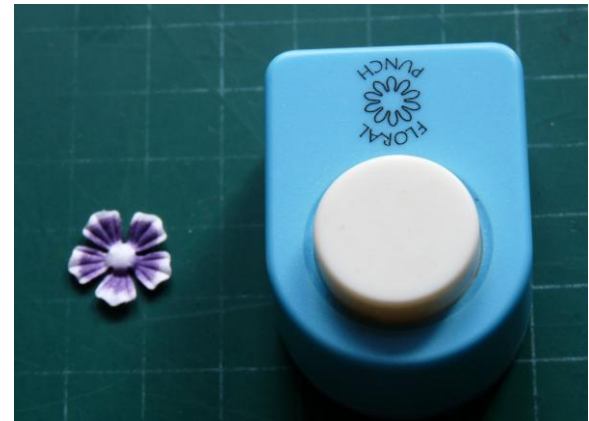
04 Embos het daarna met de witte binnenkant boven.