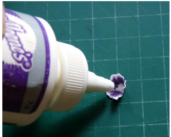
06 Doe tacky glue in het bloemetje.