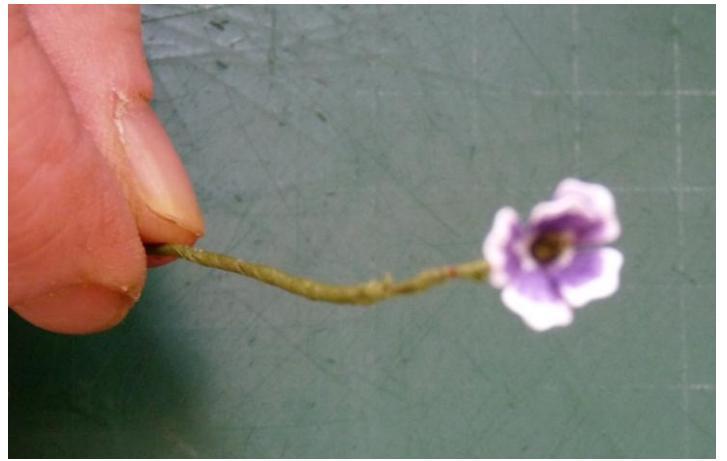
08 Schuif het helemaal naar boven en herhaal dit tot het een mooie bloementak is geworden.