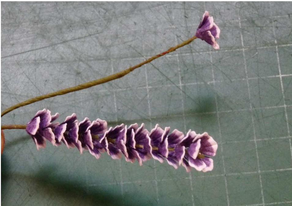
09 Het resultaat!