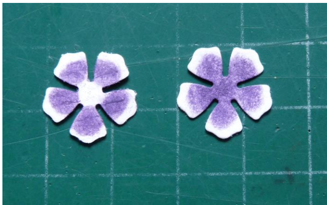
03 beinkt de voor en achterkant